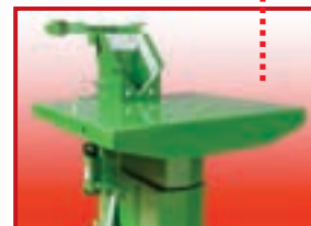
Führungen Modell M .Prof

Stabiler Rahmen und robuster Spaltkeil mit selbstschmierenden Teleskopführungen in Teflon.