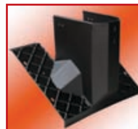
Serienmäßige Abdeckung der Steuervorrichtungen.

SONDERZUBEHÖR: Reifen ø 400 für Modell Mignon Prof EL. Artikelnr. 800.097.K